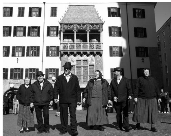
Hutterer aus Kanada zu Besuch in Tirol, Februar 2007

Weltliche wie kirchliche Autoritäten sahen in dieser Bewegung eine elementare Gefahr für die Staats- und Kirchenordnung. So setzte in kürzester Zeit eine jahrzehntelange, in Tirol besonders harte Verfolgung der Täufer und deren Sympathisanten ein: Kerker, Folter, Hinrichtungen durch Köpfen, Verbrennen (Männer), Ertränken (Frauen), Wegnahme der Kinder, Zerstörung oder Konfiszierung des Eigentums. Allein in Tirol sind rund 400 Hinrichtungen bekannt. Tausende flüchteten aus ihrer Heimat in fremde Länder, aus denen sie immer wieder – gerade wegen ihrer Einstellung zur Gewaltlosigkeit – weiter ziehen mussten. Die Erinnerung an Tirol und die Sprache nahmen sie bis heute und bis in die USA und nach Kanada mit.